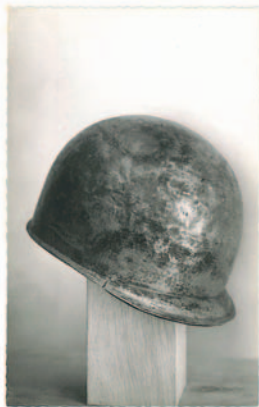
Musée de Belfort

Il faut imaginer ce soldat romain qui perdit son casque sur les terres de La Collonge et qui, en se penchant vers le sol, se posa ces simples questions :