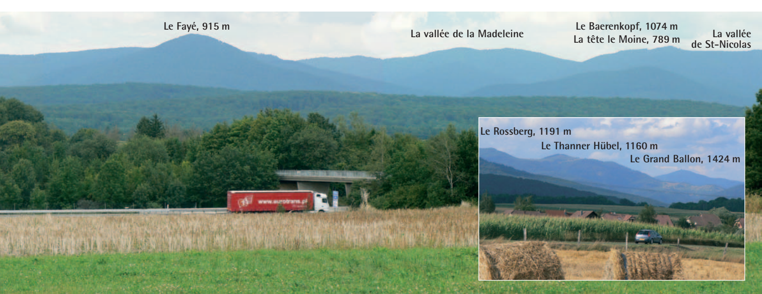
Le Rossberg, 1191 m Le Thanner Hübel, 1160 m Le Grand Ballon, 1424 m