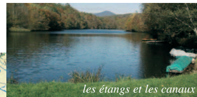
les étangs et les canaux